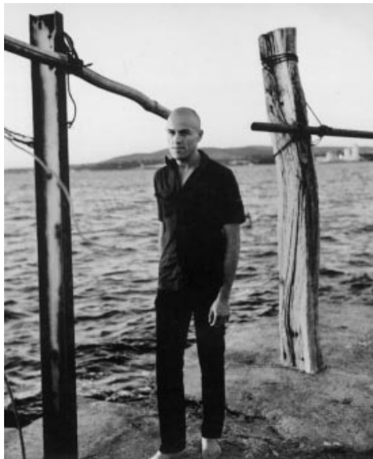
BUENOS AUGURIOS. El músico francés recoge una expresión italiana, 'Auguri' ("Mis mejores deseos") para dar título a su quinta entrega larga.

Lo último que Dominique ofreció sobre nuestros escenarios –el 28 de mayo del 99, en el ciclo Rock en el Central –, fue aquella tormenta de Remué , trasladada al directo aun con mayor fiereza que la reflejada en la grabación. "Desde luego, fue algo premeditado desde el principio –afirma–. Cuando hice Remué me di cuenta de que era un álbum muy denso, con muchos arreglos. No sólo lo trabajé desde el aspecto musical con los